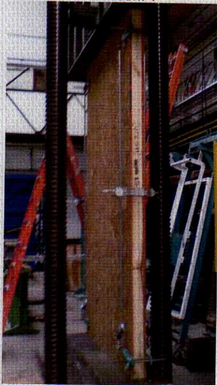
FOTOGRAFIA N° 1